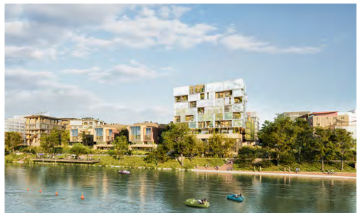
Le futur quartier qui accueillera le village des athlètes