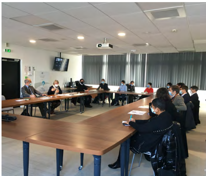
La visite-flash s'est déroulée en présentiel et en visioconférence