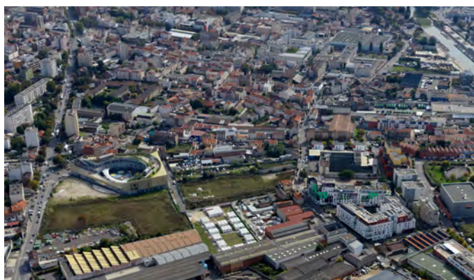
La ZAC en 2017

La SEM et Plaine Commune Énergie ont signé une convention pour la desserte en chauffage urbain de la ZAC Port Chemin Vert à Aubervilliers. Les 600 logements qui seront construits sur l'opération seront ainsi approvisionnés en chauffage et eau chaude par le réseau de chaleur de Plaine Commune Énergie alimenté à plus de 50% par des énergies renouvelables.