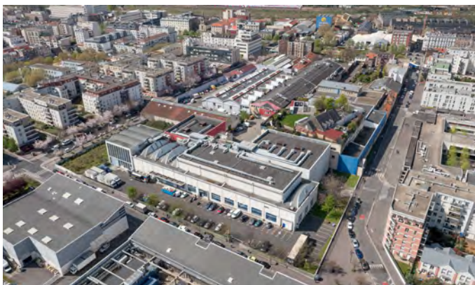
Le site à La Plaine Saint-Denis

L'occupation temporaire des 3,5 hectares de studios et d'entrepôts acquis début 2019 par Plaine Commune Développement sur la ZAC Nozal/Front populaire se poursuit. L'Agence Régionale de Santé (ARS) y loue depuis mi-novembre 2 400 m 2 d'entrepôt dans le cadre de la mobilisation face à la crise sanitaire. L'ARS rejoint ainsi les cinq sociétés des secteurs textile et audiovisuel, ainsi que les deux associations, qui occupent le site.