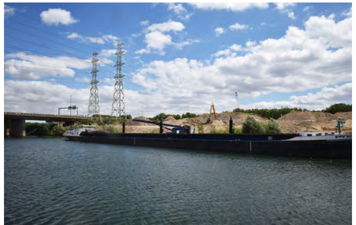
Les travaux de terrassement du village des athlètes à L'Île-Saint-Denis

Signataire de la charte entreprise-territoire de Plaine Commune, Plaine Commune Développement oeuvre à l'insertion des personnes éloignées de l'emploi en intégrant des clauses sociales à ses marchés publics. En 2020, 2 340 heures d'insertion ont été effectuées dans le cadre des marchés de terrassement, VRD et de gardiennage du village des athlètes sur la ZAC de l'écoquartier fluvial. À terme, près de 112 000 heures d'insertion seront réalisées dans le cadre des travaux réalisés par la SEM et le groupement Pichet-Legendre. Par ailleurs, ils se sont tous deux engagés à attribuer 25% des marchés à des TPE/PME et structures de l'économie sociale et solidaire. En 2020, Plaine Commune Développement a d'ores et déjà attribué 1,5 million d'euros de prestations à des TPE et PME, soit 70% de son objectif. En 2019, toutes opérations confondues, la SEM et la SPL avaient permis la réalisation de près de 12 500 heures d'insertion dans le cadre de leurs marchés et généré indirectement plus 30 300 heures supplémentaires dans le cadre des prescriptions imposées aux maîtres d'ouvrages qui construisent dans le cadre de leurs opérations.