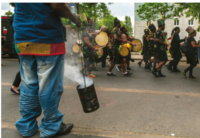
24 heures de performances collectives organisées par le collectif Random dans le cadre du projet Chrono(s)cité à Stains