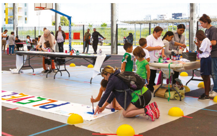
La grande rencontre, événement de clôture du projet « Le terrain, le joueur et le consultant » dans le quartier Pleyel à Saint-Denis