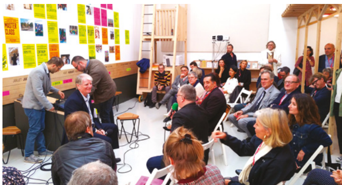
Temps de travail lors du séminaire