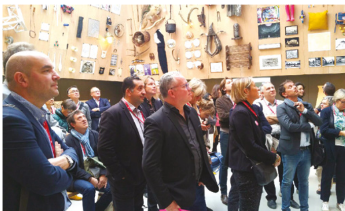
Visite du pavillon français