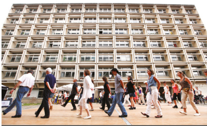
Le 6B à Saint-Denis