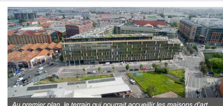
Au premier plan, le terrain qui pourrait accueillir les maisons d'art.

Plaine Commune Développement a signé un protocole d'accord avec Chanel en vue de la construction par la maison de couture de 13 000 m 2 d'artisanat et d'industrie sur la ZAC Canal - Porte d'Aubervilliers, face au nouveau siège social de Véolia.