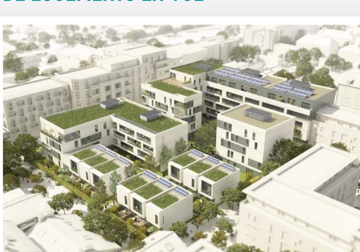
Le futur lot G.

Plaine Commune Développement a signé avec la SCCV Lamy (Cogedim, Er Créa) un protocole pour la vente du lot G2 sur la ZAC du Landy. Le permis de construire de ce programme de 33 logements en accession devrait être déposé à la fin de l'année. Il s'agit de la 2 e tranche du lot G. Les travaux de la première tranche (lot G1) - qui compte 42 logements en accession et 33 logements sociaux - seront livrés début 2017.