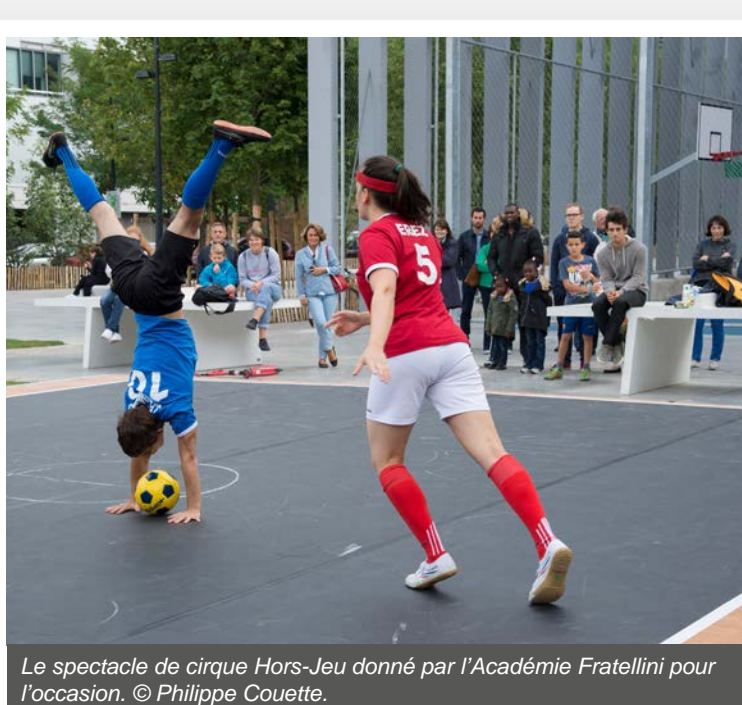
Le spectacle de cirque Hors-Jeu donné par l'Académie Fratellini pour l'occasion.

Le parc du Temps des Cerises, qui fait le bonheur des habitants et salariés du quartier depuis son ouverture au mois de juin, a été officiellement inauguré au mois de septembre à l'occasion de deux journées placées sous le signe du sport, de la découverte et de la convivialité. Aménagé par la SEM et conçu par D'ici Là Paysages et Territoires au sein du quartier Landy-France, il offre 11 000 m 2 d'espaces ouverts avec équipements sportifs (plateau couvert pour les sports collectifs, piste d'échauffement, tables de ping-pong, terrain de pétanque) et aire de jeux pour enfants.