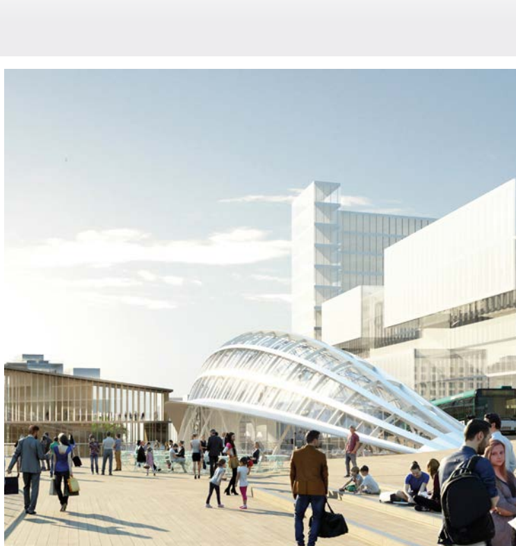
Le futur franchissement conçu par Marc Mimram Architecte.

Fin juin, le jury du concours international de maîtrise d'œuvre du franchissement urbain Pleyel, organisé par Plaine Commune avec Plaine Commune Développement en tant qu'AMO, a désigné le groupeur lauréat. Cet ouvrage d'envergure reliera La Plaine Saint-Denis aux quartiers Pleyel et Bords de Seine. D'une longueur de près de 300 m, il franchira le 3 e plus important faisceau ferroviaire au monde. Plus qu'un pont, il constituera une véritable morceau avec de généreux espaces publics, des bureaux et des commerces en rive. Les études du franchissement commenceront à l'automne pour un lancement des travaux à l'été 2018 et une mise en service fin 2023.