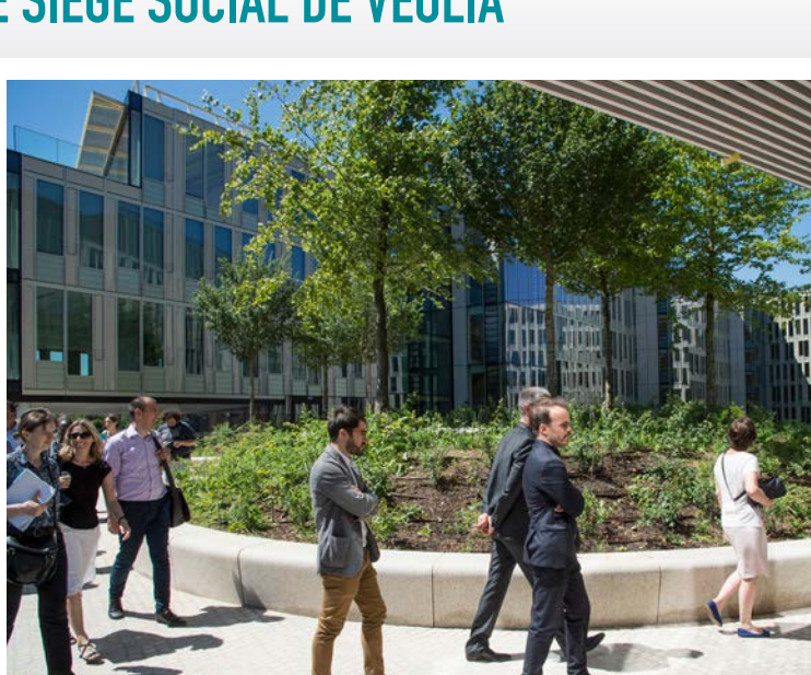
Découverte des espaces extérieurs.

Plaine Commune Développement, Icade et Véolia ont convié élus locaux et partenaires du projet à visiter le nouveau siège social de l'entreprise à Aubervilliers. Guidés par l'architecte Dietmar Feichtinger, ils ont pu parcourir ce bâtiment de 46 000 m 2 qui accueillera 1 700 collaborateurs à partir du 18 octobre. Après deux ans de travaux, la livraison de cet immeuble marque une étape importante pour la ZAC Canal - Porte d'Aubervilliers. Aménageur de la ZAC, la SEM est également intervenue en tant qu'AMO auprès d'Icade.